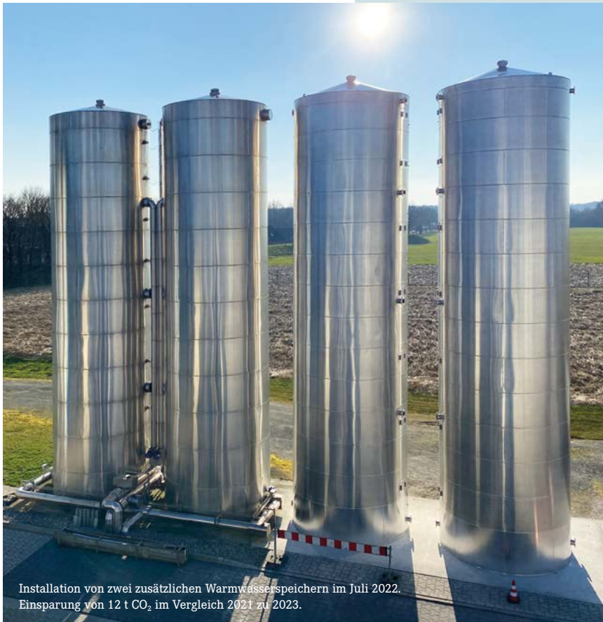
Installation von zwei zusätzlichen Warmwasserspeichern im Juli 2022. Einsparung von 12 t CO 2 im Vergleich 2021 zu 2023.