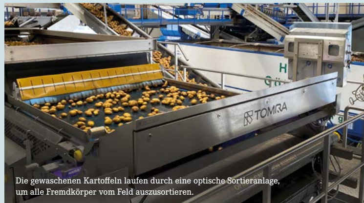
Die gewaschenen Kartoffeln laufen durch eine optische Sortieranlage, um alle Fremdkörper vom Feld auszusortieren.