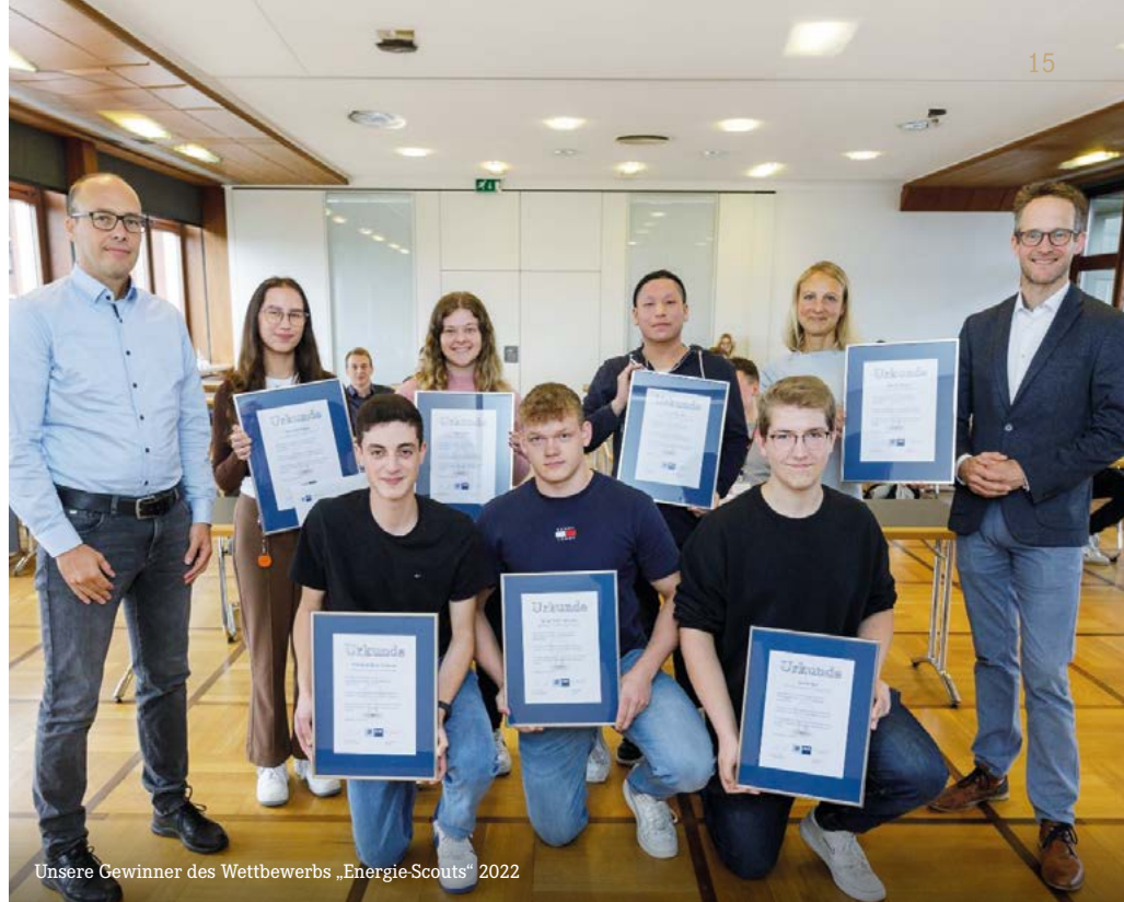
Unsere Gewinner des Wettbewerbs „Energie-Scouts“ 2022

genutzt wird. Sie enthält Speisepläne, Schichtpläne, News zur Nachhaltigkeit und anderen aktuellen Themen und kann Inhalte für fremdsprachige Mitarbeitende übersetzen. Außerdem führen wir gerade eine neue Schulungssoftware ein, die Schulungen mit automatischer Übersetzung und Bewegtbildern anbietet.